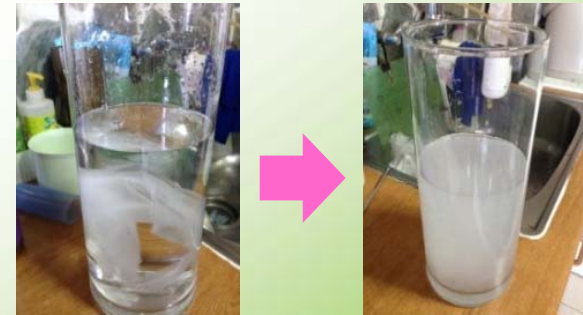
衛生紙於水中狀態

研究顯示，衛生紙投入馬桶增加之固形物沈澱量，對建築物污水處理設施（化糞池）或公共下水道初沉設施有效容積之影響試驗，顯示 投入衛生紙至馬桶 不但 不會造成堵塞 ，而且經沖水後已發生 破碎 ；但誤用面紙取代衛生紙投入馬桶時，不但 不易破碎發生 ，而且也因此容易造成馬桶堵塞（無論是否與污物一併投入馬桶），其主要原因係因面紙中添加了 濕強成分 ，不易分散破碎。